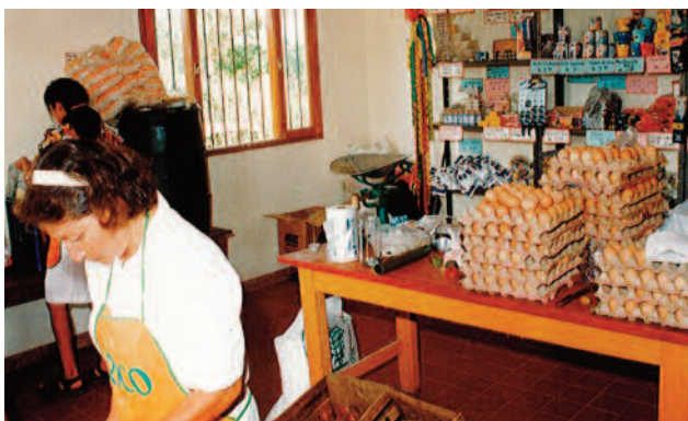
1994 BOLIVIA Proyecto de comedor