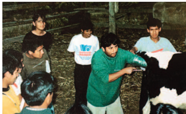
2006 PERÚ Proyecto de centro de Formación Profesional