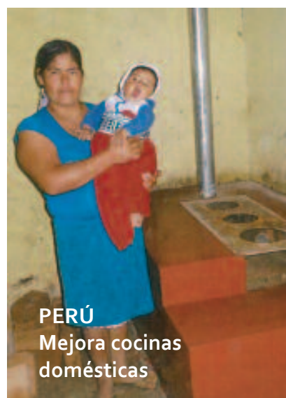
PERÚ Mejora cocinas domésticas