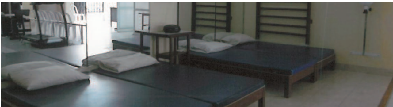
2017 PERÚ Sala de rehabilitación de un centro para personas con capacidades múltiples

“Misión América nació en el año 1993 para servir, ayudar, y apoyar a los misioneros de la OCSHA. Estos 25 años de vida de Misión América significan entusiasmo e ilusión, trabajo y constancia, pero sobre todo COMPROMISO de "ayudar a los que ayudan", los misioneros, en la construcción de un mundo más justo y más humano. Para los miembros que formamos el equipo de Misión América ha sido un regalo poder participar en este maravilloso proyecto”.